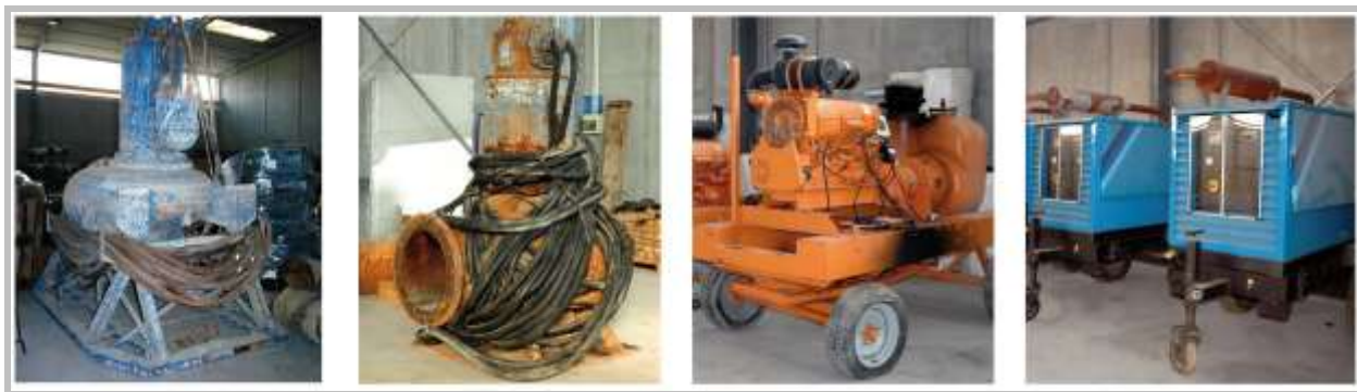
Attrezzature in dotazione al Centro di Emergenza

Il Consorzio gestisce il Centro di Emergenza per la bonifica Regionale. Le attrezzature acquistate tramite finanziamento regionale possono essere richieste da Enti territoriali in caso di evacuare acque alluvionali. Le attrezzature disponibili consistono essenzialmente in pompe sommergibili, motopompe e gruppi elettrogeni. Si rimanda all'apposito link presente sul sito web del Consorzio per la distinta delle apparecchiature.