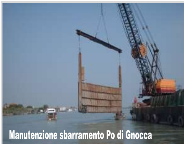
Manutenzione sbarramento Po di Gnocca