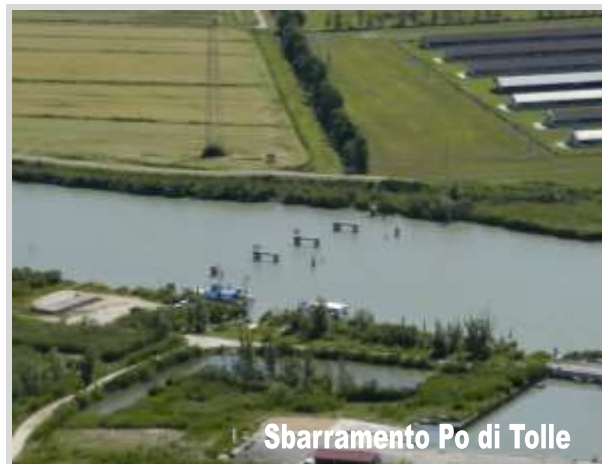
Sbarramento Po di Tolle

Si tratta di interventi impegnativi che vanno dalla posa in aprile ed il lievo della struttura in ottobre utilizzando natanti di notevoli dimensioni e stazza, alla manutenzione straordinaria delle strutture metalliche ed alla costante attenzione agli effetti che tali strutture possono innescare in un corso d'acqua.