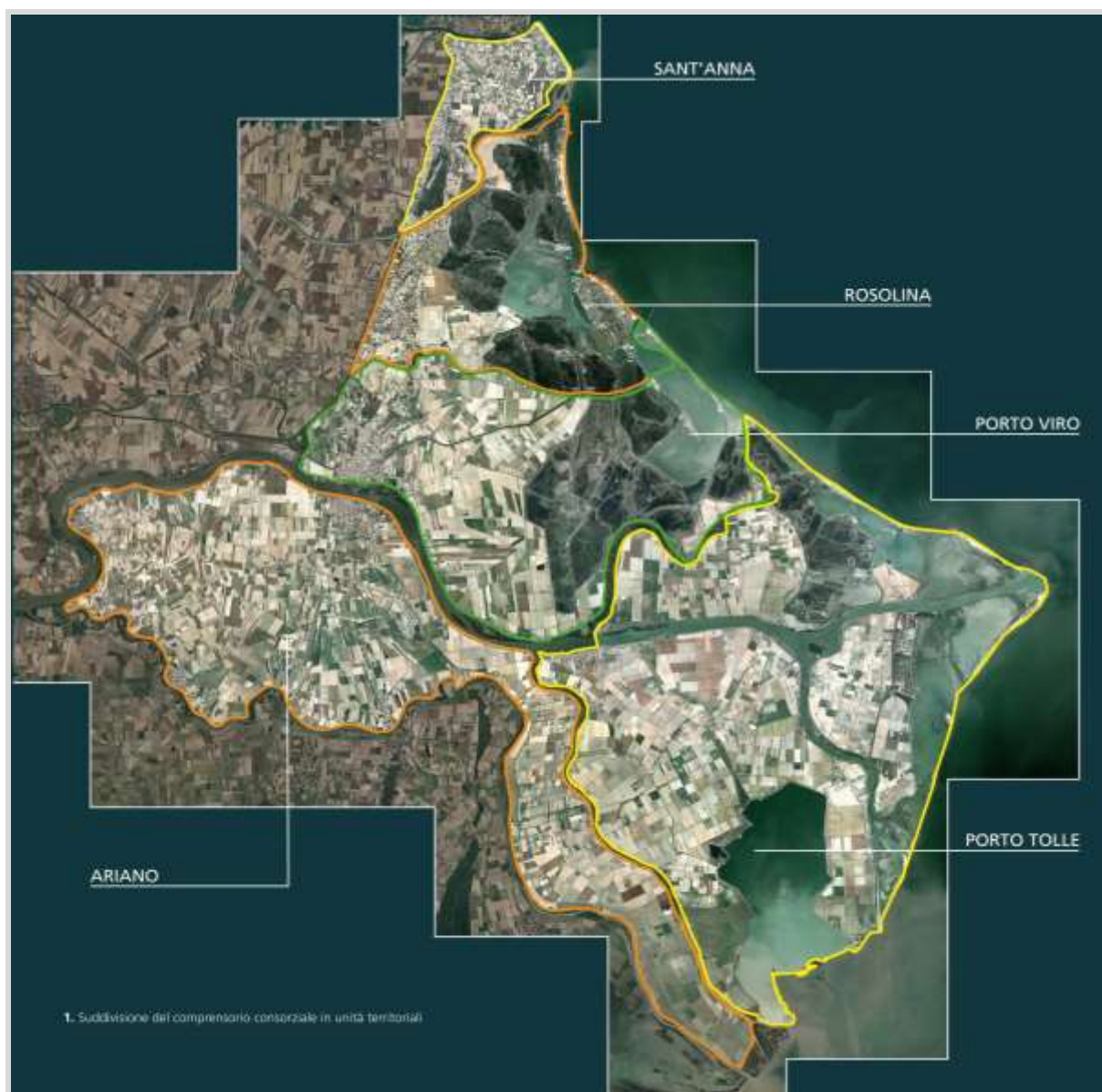
fig.1 - Unità territoriali del comprensorio consortile

Comprende l'area del Delta del Po nella provincia di Rovigo, estendentesi nelle isole di Ariano, Donzella, Camerini, Bonelli e Ca' Venier, nonché i territori di Porto Viro, Rosolina e S.Anna di Chioggia interessando i territori di otto comuni.