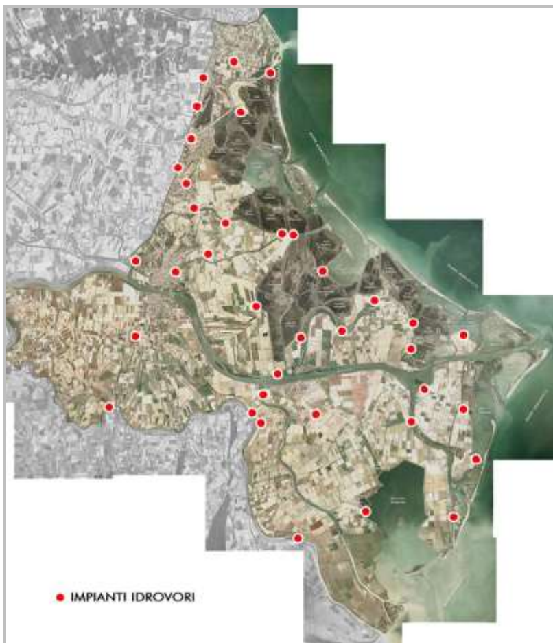
fig.2 – Ubicazione impianti idrovori

Per lo scolo delle acque meteoriche e di filtrazione dai principali corsi d'acqua che attraversano il comprensorio (rami deltizi del Po, Adige, Brenta e Po di Levante) il Consorzio si avvale di un articolato sistema di canali artificiali che fanno capo a numerosi impianti di sollevamento di varia potenzialità (fig. 2).